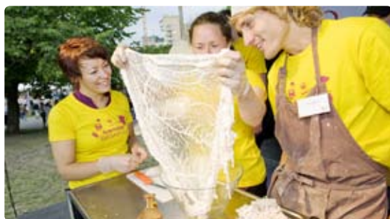
Generation Mathantverk på scenen under Smaklust 2009

Hos oss är företagarna med och formar verksamheten.