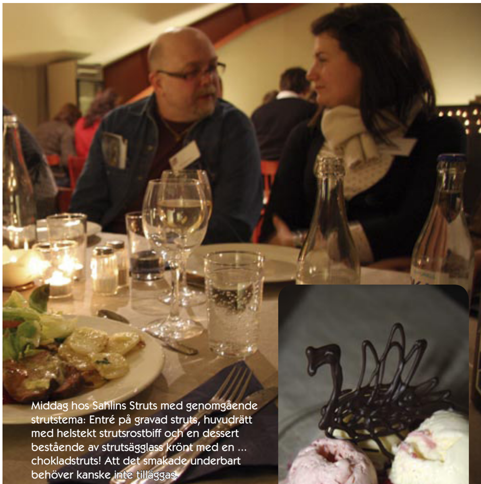
Middag hos Sahllins Struts med genomgående strutstema: Entré på gravad struts, huvudrätt med helstekt strutsrostbiff och en dessert bestående av strutsägglass krönt med en ... chokladstruts! Att det smakade underbart behöver kanske inte tilläggas.