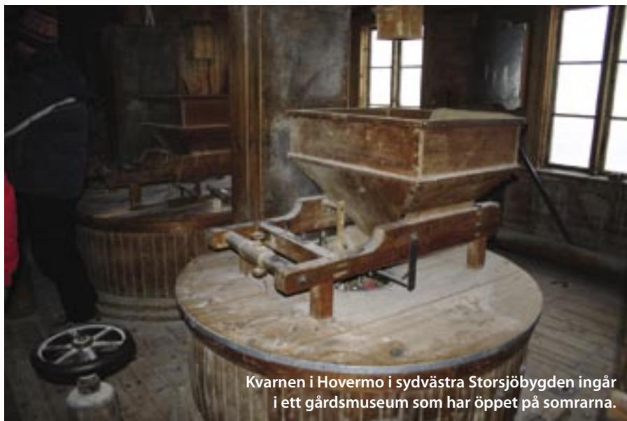
Kvarnen i Hovermo i sydvästra Storsjöbygden ingår i ett gårdsmuseum som har öppet på somrarna.