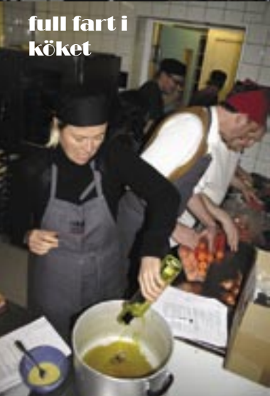
full fart i köket