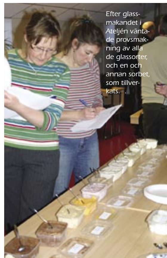
Efter glassmakandet i Ateljén väntade provsmakning av alla de glassorter, och en och annan sorbet, som tillverkats...