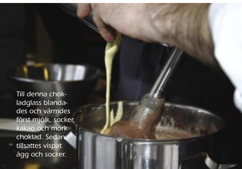
Till denna chokladglass blandades och värmdes först mjölk, socker, kakao och mörk choklad. Sedan tillsattes vispat ägg och socker.

MJÖLKFETT. Normalt innehåller glass mellan 10-16 % fett. Dess uppgift är bl.a. att ge mjuk textur genom att "smörja" gommen, förhöja smaken och göra att glassen smälter när man äter den. Olika fettsyror i mjölken har olika smältpunkt, så oavsett temperatur finns det alltid både flytande fett och fettkristaller i glassen. En glassmet med lågt fetthinnehåll är extra viktig att röra om under infrysningen för att inte få för stora iskristaller. Parfait är en