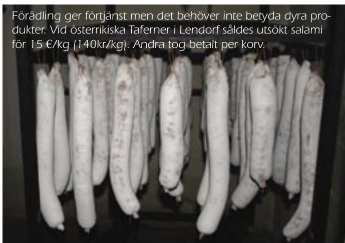
Förädling ger förtjänst men det behöver inte betyda dyra produkter. Vid österrikiska Taferner i Lendorf såldes utsökt salami för 15 €/kg (140kr/kg). Andra tog betalt per korv.