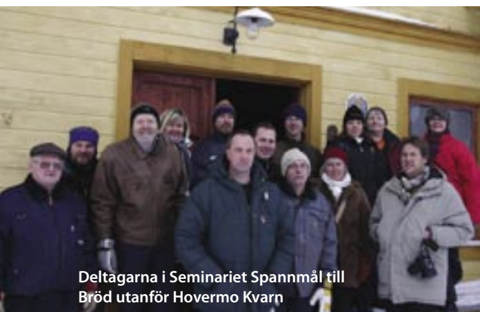
Deltagarna i Seminariet Spannmål till Bröd utanför Hovermo Kvarn

är mjölkbonde i Ragunda. Han odlar korn både till djurfoder och till brödspannmål. "Vi odlar mycket korn (Baroness) till foder. Vi vill ha högt näringsinnehåll till djuren, inte bara hög avkastning. Vi odlar ekologiskt och har ekologisk djurhållning. Vi odlar vårkorn som vi mal och använder till korntunnbrödet. Det är odlingssäkert, men kräver växtföljd för att undvika ogräsexplosion. Vi odlar spannmål max 2 år i följd, då får tisteln t ex inte en chans. Vi odlar råg, Amando, som ger mycket halm. Vissa år har halmen varit mer efterfrågad än kornet. Vi har två spannmålstorkar + en planbottentork där man kan kalltorka (om det är under 20% vatten). Men det får inte torka för fort heller, 40-45 grader är lagom i varmluftstorken. Svedjeråg är minst kalkkrävande av alla sorter."