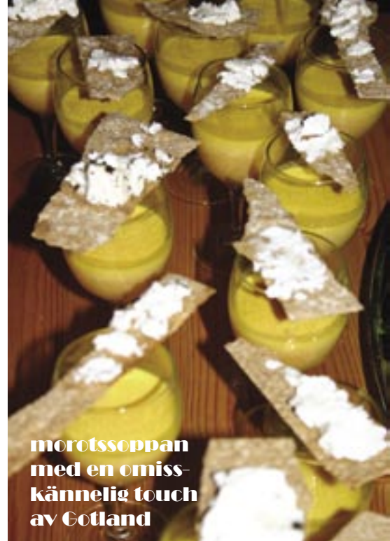
morotsoppa med en omiss- kännelig touch av Gotland

SÅ VÄLSMAKANDE och bra mat som vi åt under dessa dagar är få förunnat; tack alla ni som levererade era bästa produkter till oss, en sann njutning och upplevelse var det! & ett tack till vår eminente kock