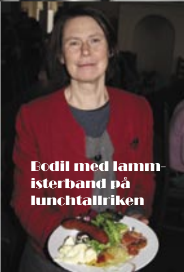
Bodil med lamm- isterband på lunchtallriken

Även medier som arbetar snabbt ska bearbetas såsom Webbsidor och bloggar. Vi ska skaffa oss många olika samarbetspartners.