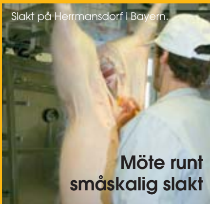
Slakt på Herrmansdorf i Bayern.