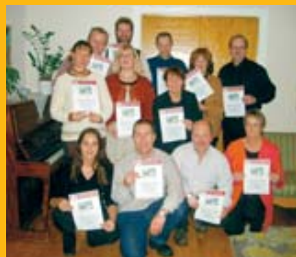
Diplomerade i småskalig livsmedelsförädling.

Anmälan och kostnad Kursen kostar 4 000 kr (exkl. moms) för deltagare från Jämtlands län. För er boendes utanför Jämtlands län kontakta oss för närmare prisinformation. Kurslitteratur ingår. Anmälan till Eldrimner senast 3 september 2004.