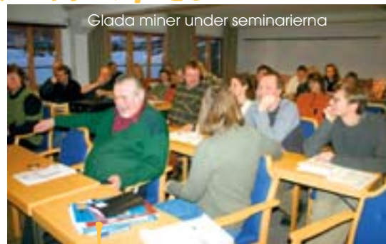
Glada minner under seminarierna