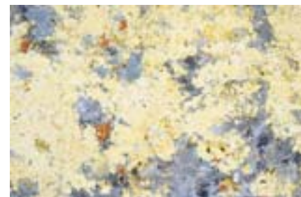
Olika mögelsorter - vad man kallar en blommande yta.