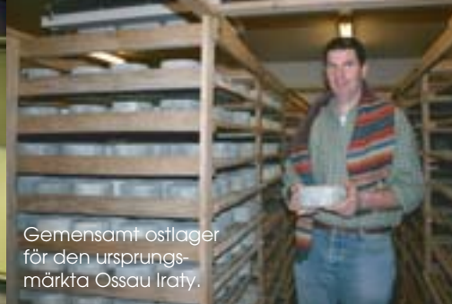
Gemensamt ostlager för den ursprungsmärkta Ossau Iraty.

grottan innan de förpackas i tennpapper för färdiglaging. Grotterna håller naturligt rätt temperatur och luftfuktighet. Det sker också en naturlig luftväxling beroende på sprickor i berget. Bara de ostar som lagrats i dessa grottor får heta Roquefort. Ostarna exporteras över hela världen.