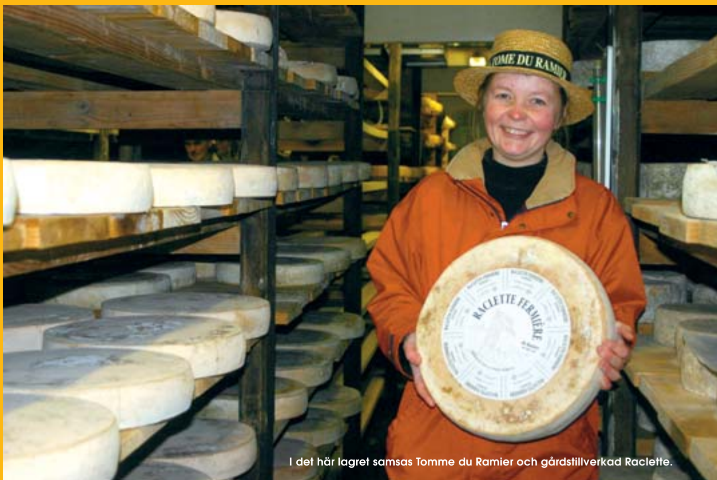
I det här lagret samsas Tomme du Ramier och gårdstillverkad Raclette.

Läs mer om de trevliga och givande dagarna vid Mimesbrunnen i Storhogna på sid 6.