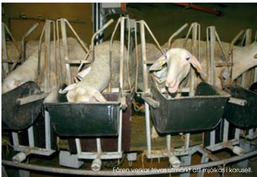
Fåren verkar trivas utmärkt att mjölkas i karusell.