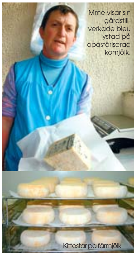
Mme visar sin gårdstillverkad bleu ystad på opastöriserad komjolk.

Så landade vi då, 1 000 m över havet på flygplatsen i Clermont Ferrand, som ligger i centralmassivet. Denna fanatiska blueostresa som lika mycket kom att bli en fårmjölksresa, vilket vi tyckte var mycket spännande. Vi kunde inte besöka alla bleuost-mejerier som vi planerat eftersom flera mejerier var blockerade av producenterna efter att de hade aviserat en mjölkprissänkning. Vår första natt sov vi på Hotel de la Poste i byn Laqueuille, ett riktigt franskt landsorts hotell som vi har återvänt till många gånger under våra resor. Första studiebesöket nästa morgon var också i Laqueuille på ett kooperativ som tillverkar olika typer av bleuost, främst Bleu de Laqueuille och Bleu d' Auvergne. Skillnaden mellan dessa två ostar är bara att fetthalten i Bleu d' Auvergne är högre och den senare är också en ursprungsskyddad ost. Det som var särskilt spännande vid detta besök var att vi fick se varje moment i ystningen under vår rundvandring i mejeriet eftersom mejeriet är så stort att allt pågick samtidigt. Vi kunde bla se hur fint "klädda" ostkornen blev innan formsättning.