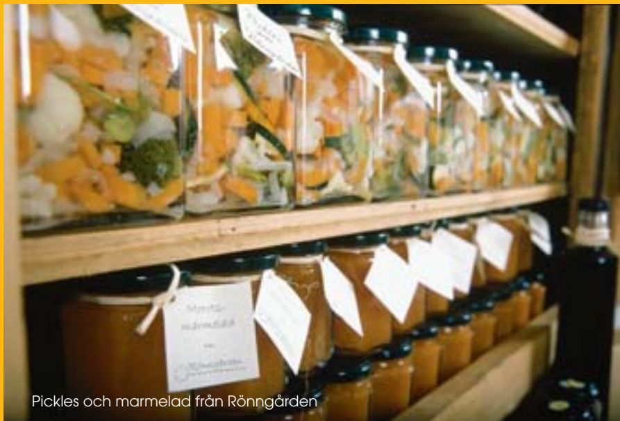
Pickles och marmelad från Rönngården