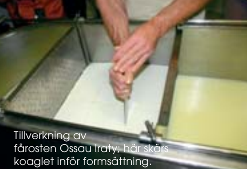
Tillverkning av färosten Ossau Iraty; här skärs koaglet inför formsättning.