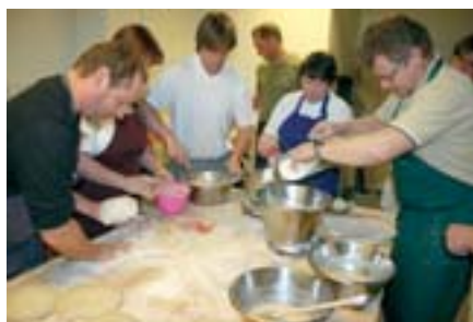
Full fart i bagarstugan.