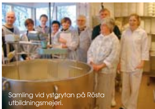
Samling vid ystgrytan på Röstas utbildningsmejeri.