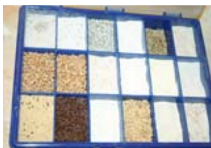
Olika korn, kross, mjöl och fröer.

Råvarorna är naturligtvis även när det gäller bröd av stor betydelse t ex malningsgraden på mjölet. Utvecklingen har gått mot finare och finare mjöl, och resultatet bli annorlunda än med grövre mjöl. Vi får en genomgång av de fyra sädeslagen samt dinkel, kamut, amaranth, bovetemjöl, barkmjöl, quinoa, olika fröer, kryddor, om deras egenskaper och malningsgrader etc. Phsyllumfrön t ex används i glutenfritt bröd.