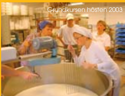
Grundkursen hösten 2003

Kursen vänder sig till dig som vill börja förädla gårdens eller bygdens produkter i liten skala till t ex ost, chark, sylt, saft, bröd, grönsaksinläggningar, fisk eller annat. Den skall ge dig kunskaper och beslutsunderlag för att du skall