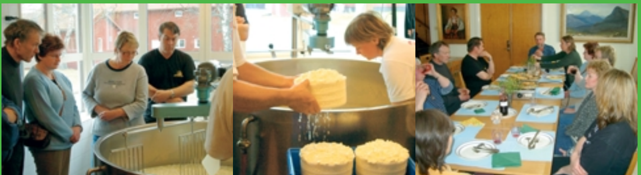
Deltagarna är med på en ystning i Rösta Mejeri och samtalar sedan om ystning och ostar kring lunchbordet.

Efter ystningen var det lunch, då det serverades granbarksost med sallad och bröd, en lunch då alla fick sig till livs att ost är mycket mer än ett pålägg. Jag tror att vi alla var ordentligt mätta efter den måltiden. Efter maten var det tid för reflektioner över dagen, tid att få svar på de frågor som dykt upp och lite för mer information om Eldrimner. Deltagarna verkade nöjda med dagen och man kan tro att det hos någon börjat att växa en tanke på att tillverka ost av sin mjölk.