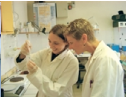
I laboratoriet på Carmejane utförs ex olika tester med mjölksyrakulturer.

huvudsakligen med bär- och grönsaksförädling, chark samt lite om ystning.