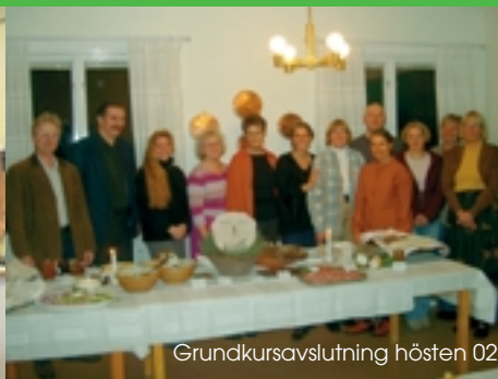
Grundkursavslutning hösten 02

Anmäl dig till träffen till oss på Eldrimner (se längst bak i bladet) senast 15 september. Vi tar inte ut någon avgift för dagen. Lunchen kostar 55 kr och betalas kontant. Välkommen!