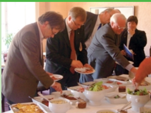
Närings-, Lag- och Miljö- och Jordbruksutskottet huggar glatt in på Eldrimner-buffén.

Trots allt detta möttes våra förslag av en mycket positiv attityd från departementsfolkets sida. De menade att verksamheten vid Eldrimner ligger i tiden och kommer att kunna finansieras från 2006, men det gäller att hitta lösningar för att centret ska överleva