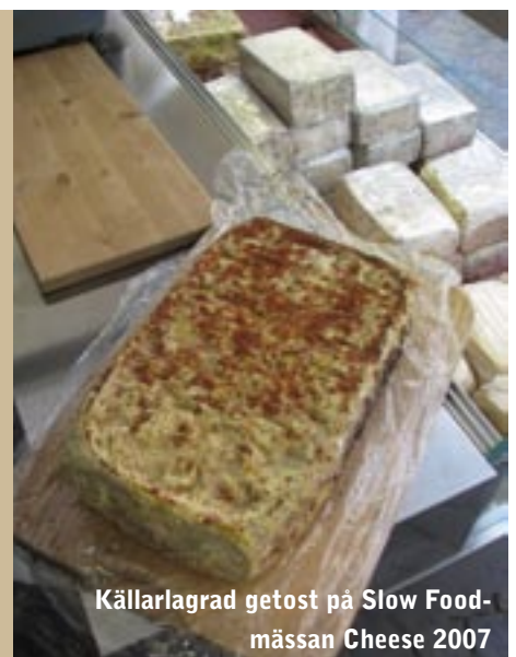
Källarlagrad getost på Slow Food-mässan Cheese 2007