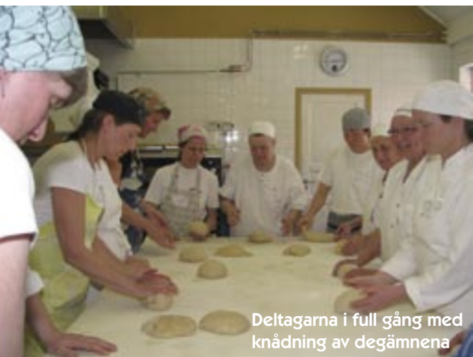
Deltagarna i full gång med knådning av degämnena