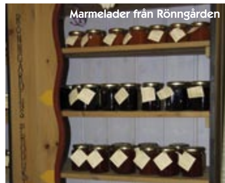
Marmelader från Rönngården