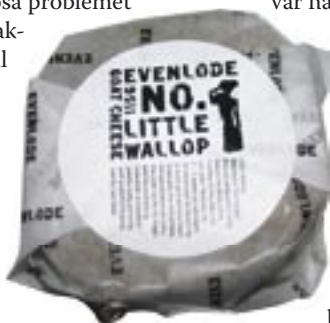
Getost från Whitelake Cheeses, Somersset

Den gården var alla överens om kunde ha haft bättre omvårdnad av sina djur. Många var halta och avmagrade. I mejeriet hade pojkarna rationaliserat bort vändning av ostarna vilket satte funderingar i alla fall i mitt huvud.