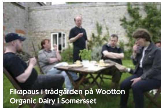
Fikapaus i trädgården på Wootton Organic Dairy i Somersset

Det kändes helt plötsligt ganska oroligt och som tur var fick vi gå ur och promenera sista biten ner till gården. Chauffören, stackaren fick försöka lösa problemet under tiden vilket han faktiskt gjorde!! En eloge till honom!