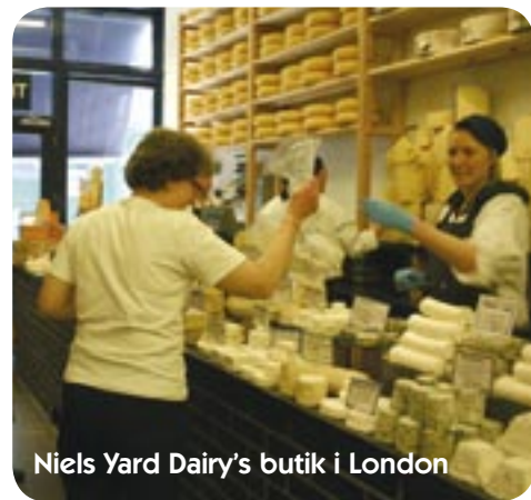
Niels Yard Dairy's butik i London