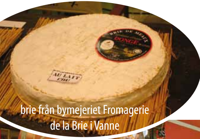
brie från bymejeriet Fromagerie de la Brie i Vanne

Eldrimner begav sig på den årliga ystningsresan – ja, det har nog blivit en studieresa per år sedan start – och denna gång blev det ett "återbesök" på mässan Salon International de l'Agriculture (SIA) i Paris och utforskande av nya ostmarker i omgivningarna kring Paris och norrut. Ta del av resan i detta fotoreportage!