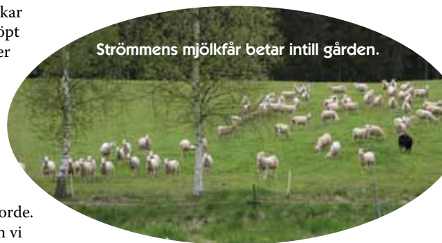
Strömmens mjölkfår betar intill gården.