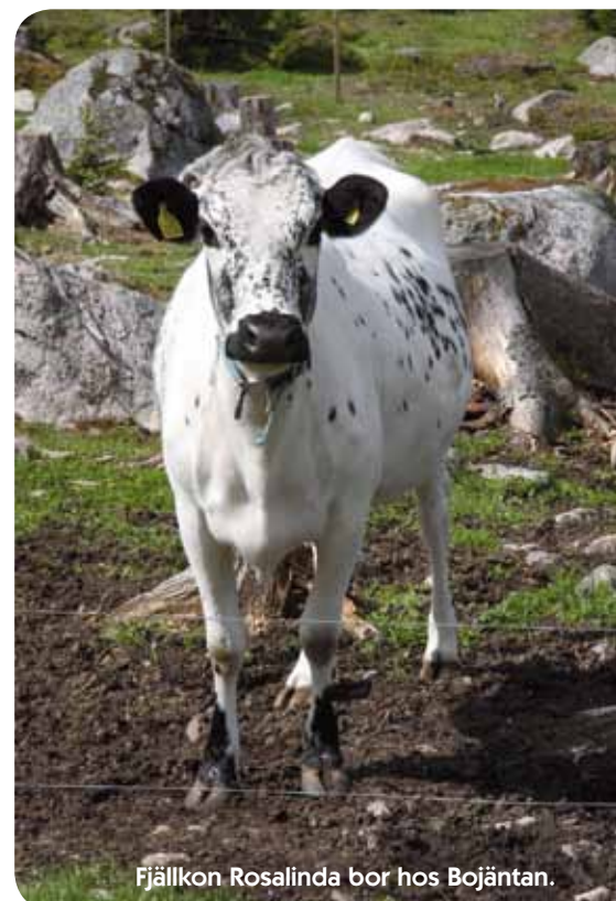
Fjällkon Rosalinda bor hos Bojäntan.