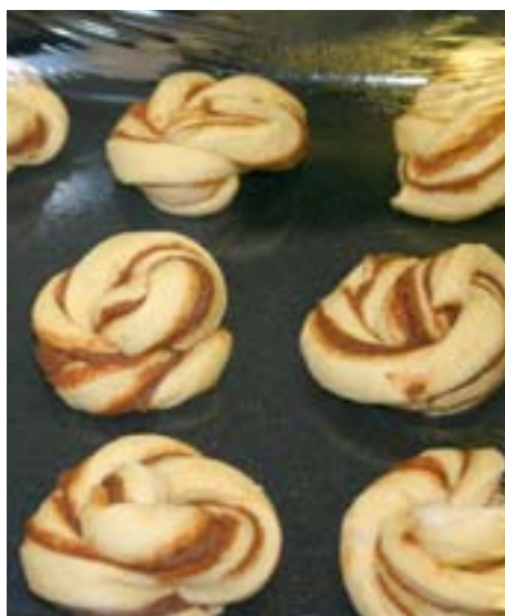
Bilden t vä: Kanelnäckor. Mittens: Surdegar på jäsning. T hö: Vetesurdeg