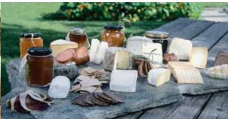
Hantverksmässigt tillverkat - ger unika produkter med mersmak.