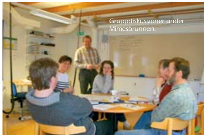
Gruppdiskussioner under Mimesbrunnen.

Informationsmöten runt omkring i landet, Nationellt kontaktnätverk med förankring i varje län, Hur skall vi hjälpa till att bygga upp regionala resurscentra, Samarbete med olika producentorganisationer som arbetar med småskalig hantverksmässig livsmedelsförädling, Samarbete med projekt.