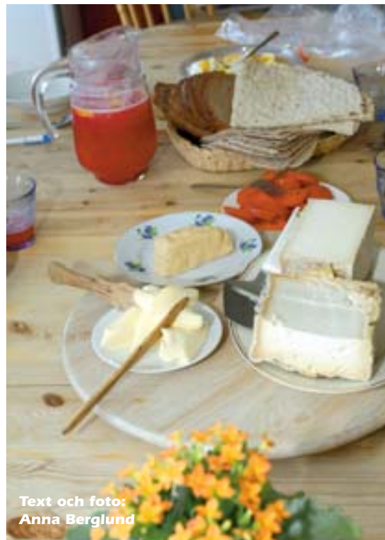
Text och foto: Anna Berglund

- Rejo och jag är vegetarianer, det var en anledning till att vi ville satsa på ost. Vi blir också bjudna på en fantastiskt god bärjuice. En råjuice med röda vinbär, svarta vinbär och krusbär. Rejo öppnar köksskåpet och visar en liten hushållskvarn som de mal sitt mjöl med. I skåpet står fullt av hinkar och säckar med spannmål. De köper helt korn av olika sädeslag från Kung Markatta, mal och bakar bröd.