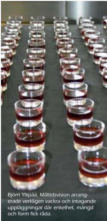
Björn Yllipää, Måltidsvision arrangerade verkligen vackra och intagande uppläggningar där enkelhet, mängd och form fick råda.

större utsträckning värdesätter kvaliteten och inte enbart ser till priset. Ett bra exempel är vin. Det är en vara som man ej köper enbart för att det är billigt.