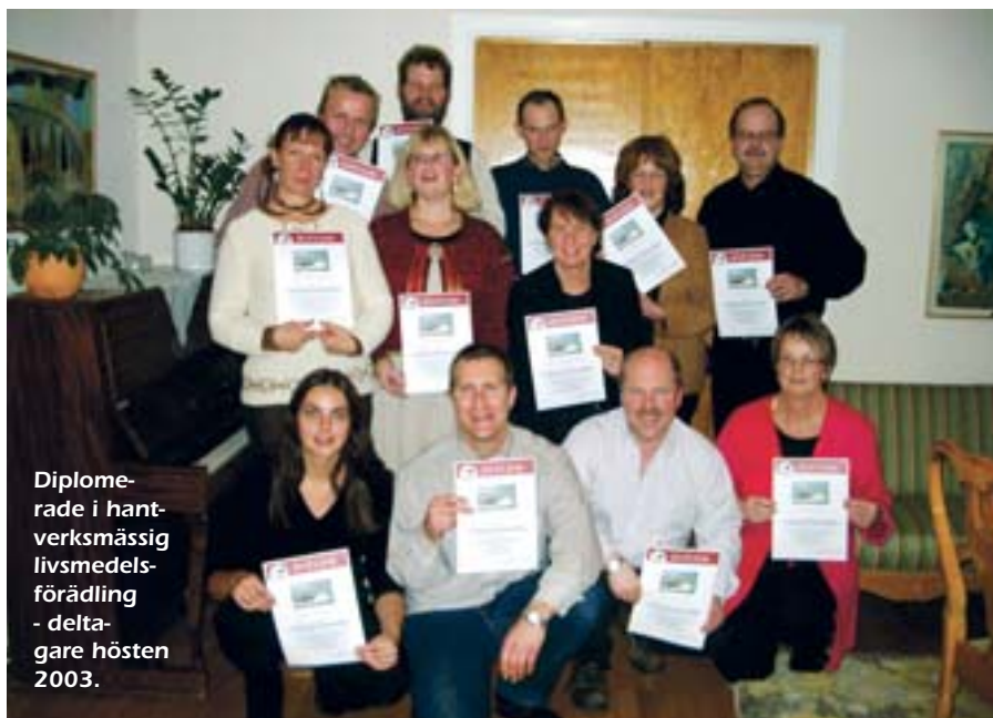
Diplome- rade i hant- verksmässig livsmedels- förädling - delta- gare hösten 2003.

Grunden är ett planeringsarbete som du gör för ditt eget företag/ affärsidé. Seminariereserien omfattar 26 dagar (182 timmar) varav fem dagar är specialkunskap inom det område du väljer att förädla (ystning, charktillverkning, fiskförädling, syltkokning, brödbak eller annat), två dagar är praktik på ett företag och fem dagar självständigt arbete. I seminariereserien ingår småskalig livsmedelsförädling i Sverige och Europa,