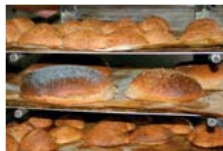
Källa: anteckningar samt ur Jörns bok "Fra korn till bröd"