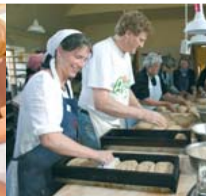
Brödkurs på Aurions Bageri, under studieresa till Danmark.