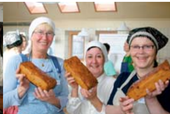
T vä: Här knådas det för fullt av ivriga kursdeltagare från Danmark och Sverige. Mitten: Pumpernikkel bröd på jäsning i de träformar som de sedan gräddas i. T hö: Tre glada kursdeltagare från Eldrimnerresan med honung-salt bröd i händerna.