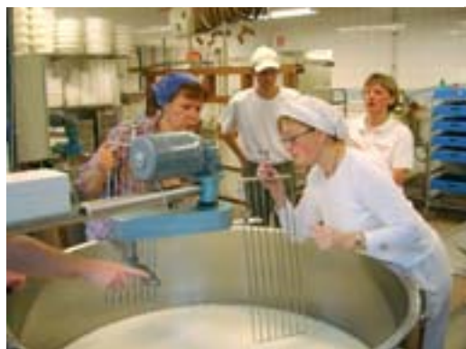
Ystning i Rösta Mejeri under grundkursen i småskalig livsmedelsförädling.

Resurscentrum för småskalig livsmedelsförädling