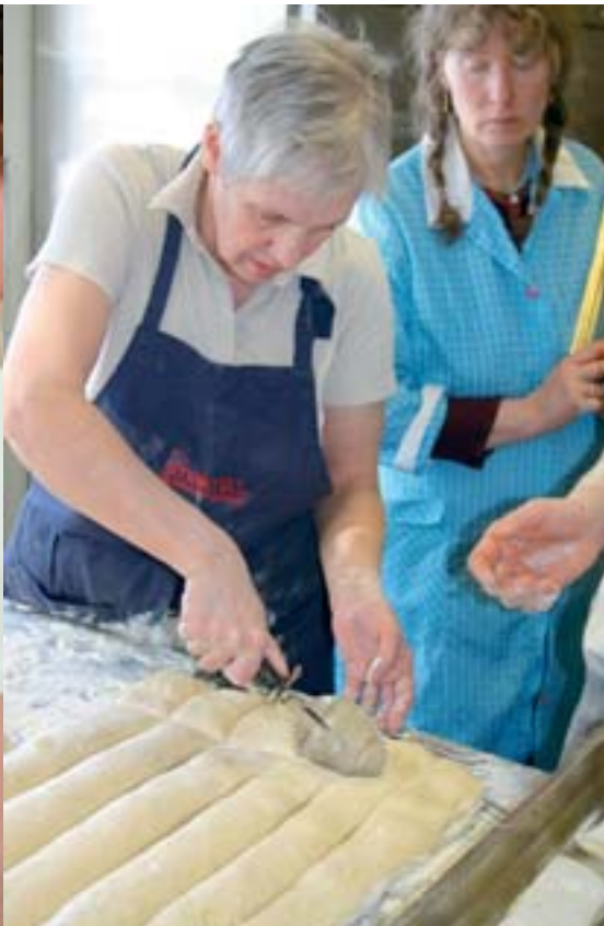
Kursdeltagare i färd med att dela upp styckbröden.

Vi har väl alla på ett eller annat sätt kommit i kontakt med detta företag. Det kommer utskick gång efter annan och en sak vet jag att jag har gemensamt med många: vi har köpt böcker, inte bara en gång utan vid flera tillfällen! Företaget är Björn Lundén Information AB. Jag har alltid nyfiket funderat, hur tänker dom? varför? Nu har jag fått många svar på dessa frågor och det genom en öppenhjärtigt och mycket inspirerande föreläsning.