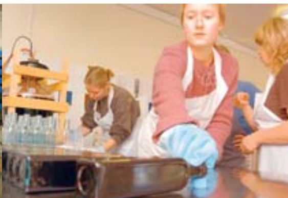
Nektartillverkning under kurs i bärproduktion på Særimner.