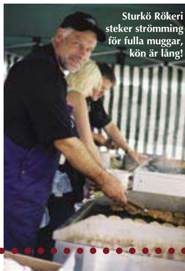
Sturkö Rökeri steker strömming för fulla muggar, kön är lång!

Det sista hörde hon inte – hon har sprungit vidare i sin sista-minuten-jakt på potatisdelikatessen som är så svår att få tag på färsk här i huvudstaden. Stackars stockholmare!