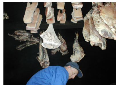
Kjøtt i badstuovn, bilde fra tidligere aktivitet i SGSN